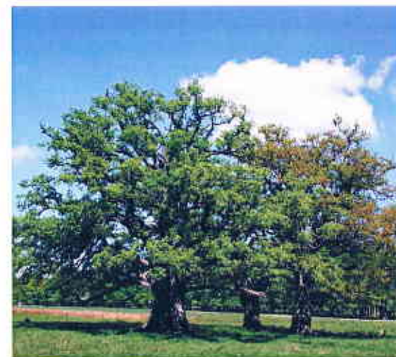
Egetræets karakteristiske krogede krone træder rigtigt i karakter, når træet får lov til at udfolde sig relativt fritvoksende i spredte grupper.

Træerne, der synes at være plantet lige lovligt systematisk på lige trækker, har med den tætte planteafstand trukket de enkelte træer meget lodret opad, og det kunne være passende at foretage en udtyndning, således at de enkelte egegrupper ikke virker så krat-agtige. Ved udtyndningen kan man sørge for at plukke i rækkerne, så der opstår et mere frit plantemønster, der igen er medvirkende til at lunden kan udfolde sig som en naturlig trægruppe, hvor kronerne langsomt vokser sammen. Ved en udtyndning opnås også en større gennemsigtighed i området til glæde for bagvedliggende sommerhuse.