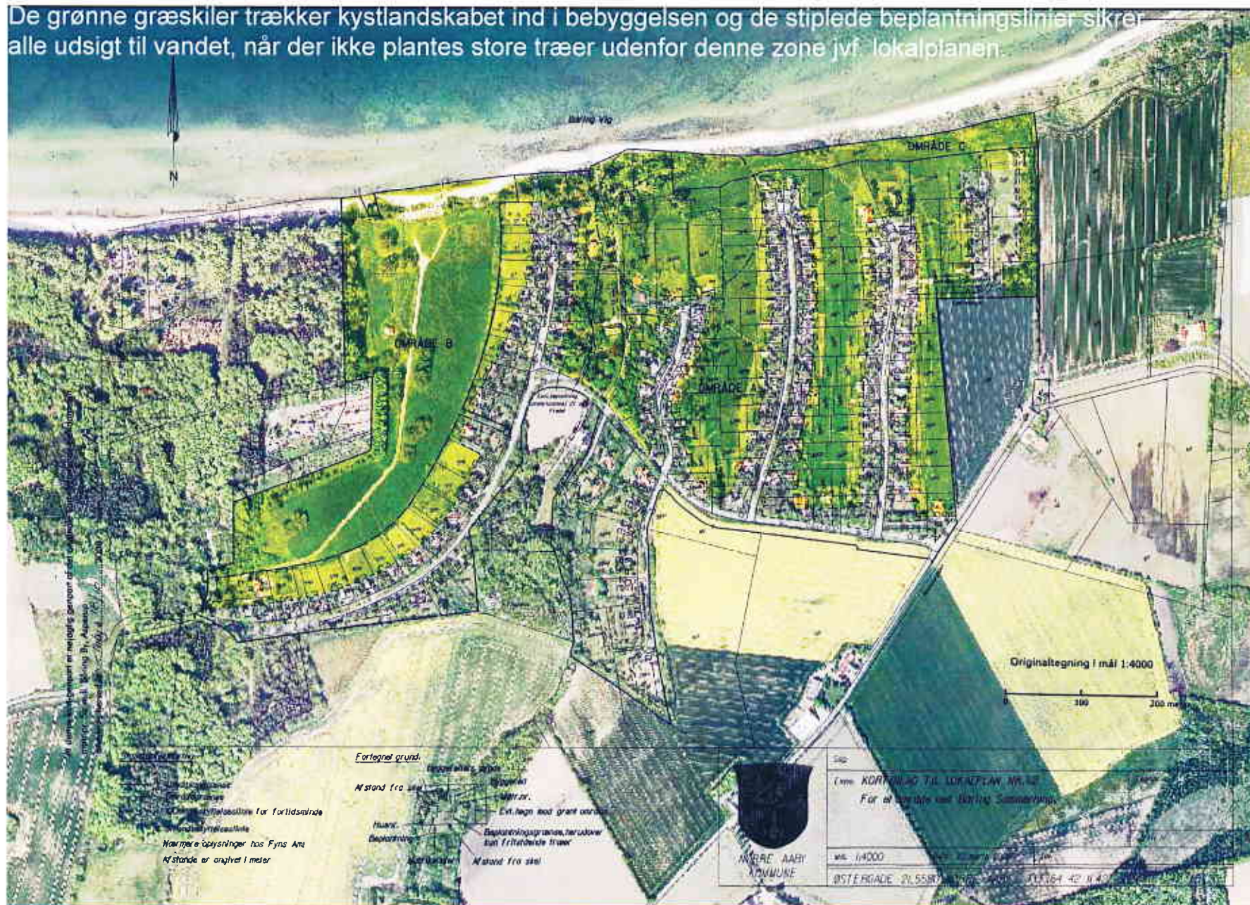
Kortbilag fra lokalplan 62 med luftfoto 2008

De grønne græskiler trækker kystlandskabet ind i bebyggelsen og de stiplede beplantningslinier sikrer alle udsigt til vandet, når der ikke plantes store træer udenfor denne zone jvf. lokalplanen.